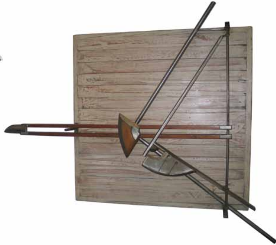
0052 B De La flechas | acero y madera. 1989