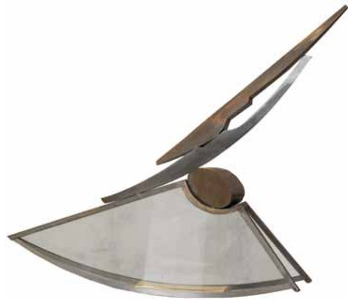
0150 serie abertura 2 | acero inox. vidrio 114 x 18 x 91 cm. 2011.