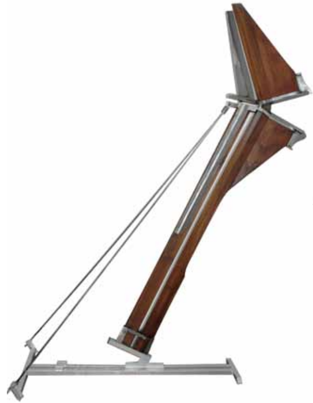
0147 Devoranos | Acero y madera 185 x 68 x 235 cm. 1989.