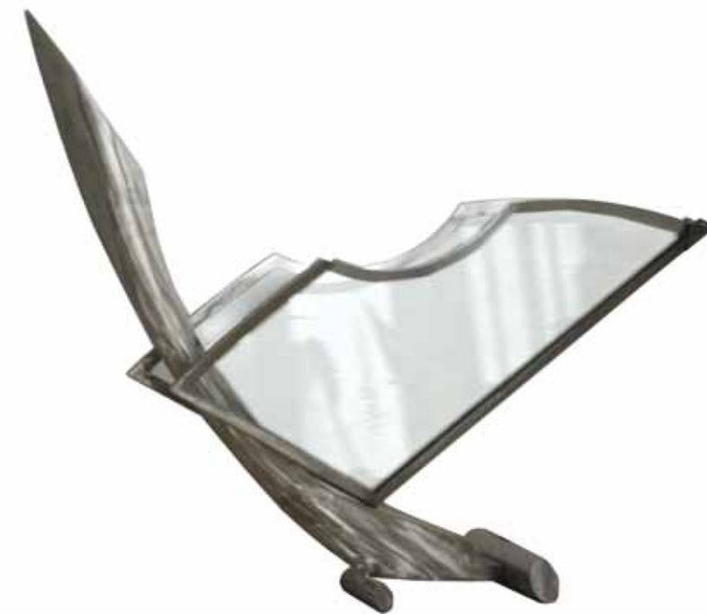
0159 serie abertura 5 | acero inox. vidrio 125 x 27 x 87 cm. 2011.