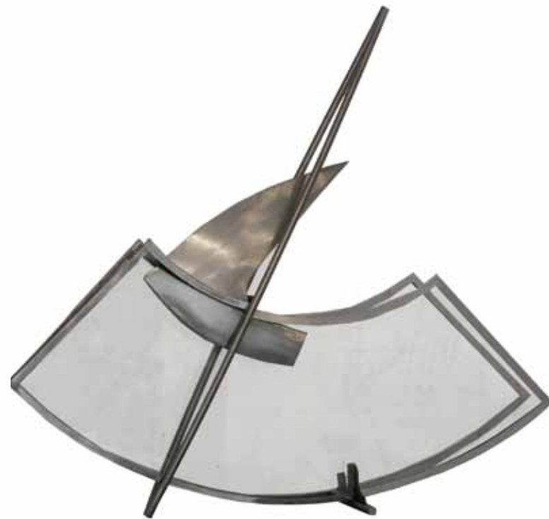
0151 serie abertura 3 | acero inox. vidrio templado 114 x 18 x 91 cm. 2011