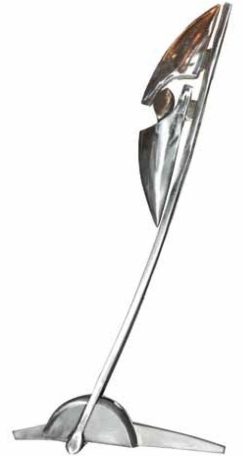
0143 apertura 7 | acero inox 25 x 0,7 x 52 cm. 2008.