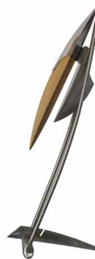
0155 serie apertura 9 | acero inox ceregeira 36 x 20 x 100 cm. 2011.