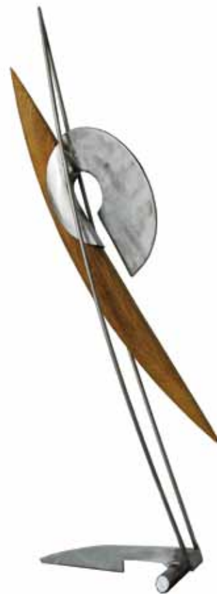
0157 serie apertura 11 | acero inox. ceregeira 33 x 13 x 78 cm. 2011