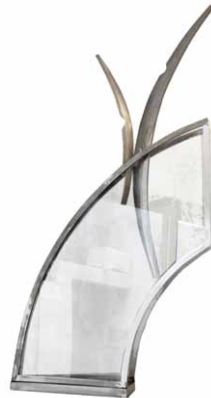
0153 serie abertura 4 | acero inox. vidrio 66 x 22 x 132 cm. 2011.