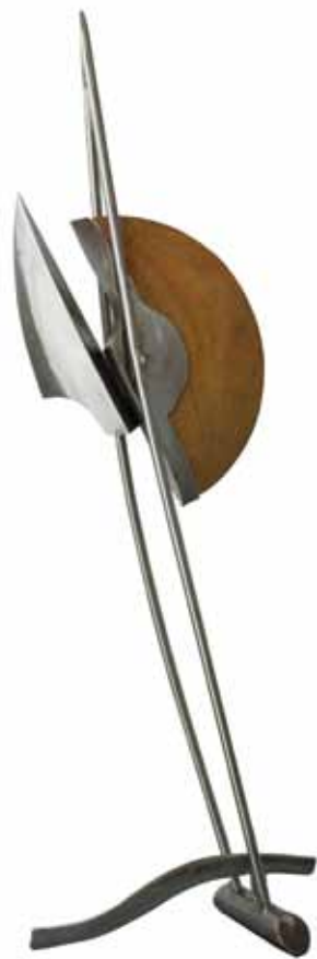
0156 serie apertura 10 | acero inox. ceregeira 38 x 20 x 105 cm. 2011