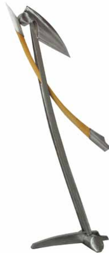
0154 serie apertura 8 | acero inox ceregeira 60 x 23 x 113 cm. 2011.