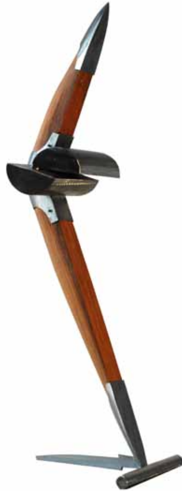
0172 Serie Obertura | 14 Acero inox pinotea RD 0.32 x 0.24 x 1.03. 2012