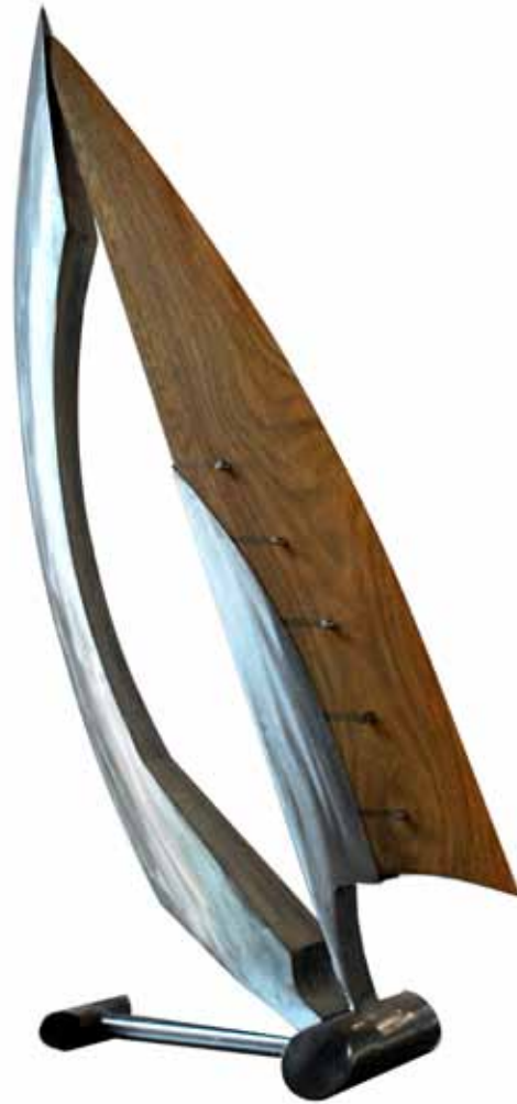
0169 Serie Obertura | 10 Acero inox ceregeira RD 0.50 x 0.28 x 1.03. 2012