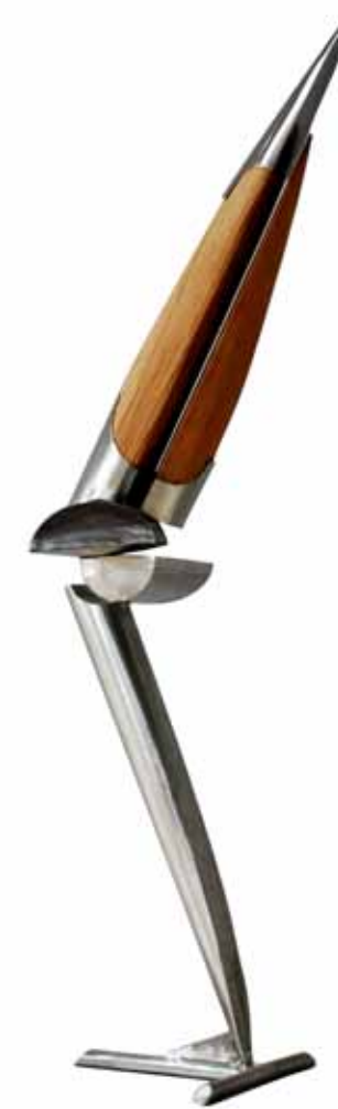
0173 Serie Obertura | 15 acero inox Pinotea RT 0.54 x 0.33 x 1,54. 2012