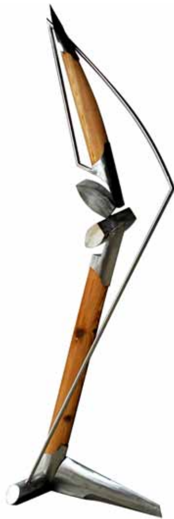
0174 Serie Obertura | 16 Acero inox Pinotea RT 0.70 x 0.53 x 2.30. 2012