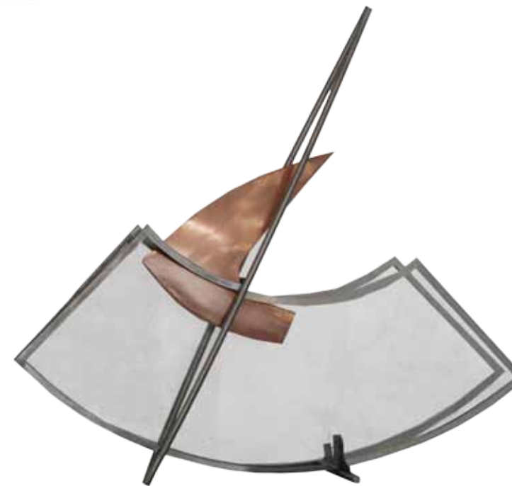
0151 M Serie Obertura 3 Acero inox ceregeira vidrio templado chica. 2011