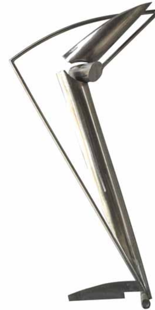
0170 Serie Obertura | 12 B acero inox RD 0.52 x 0.25 x 0,98. 2012