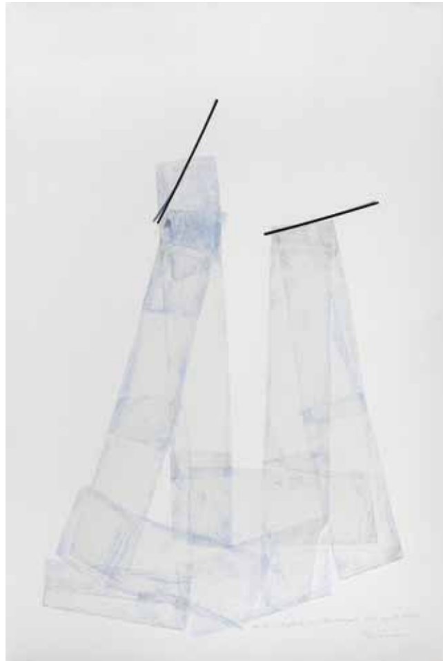
Linea Sostenida - 2 grafito, vinilo y linea de papel 0,40x0.50 mt.