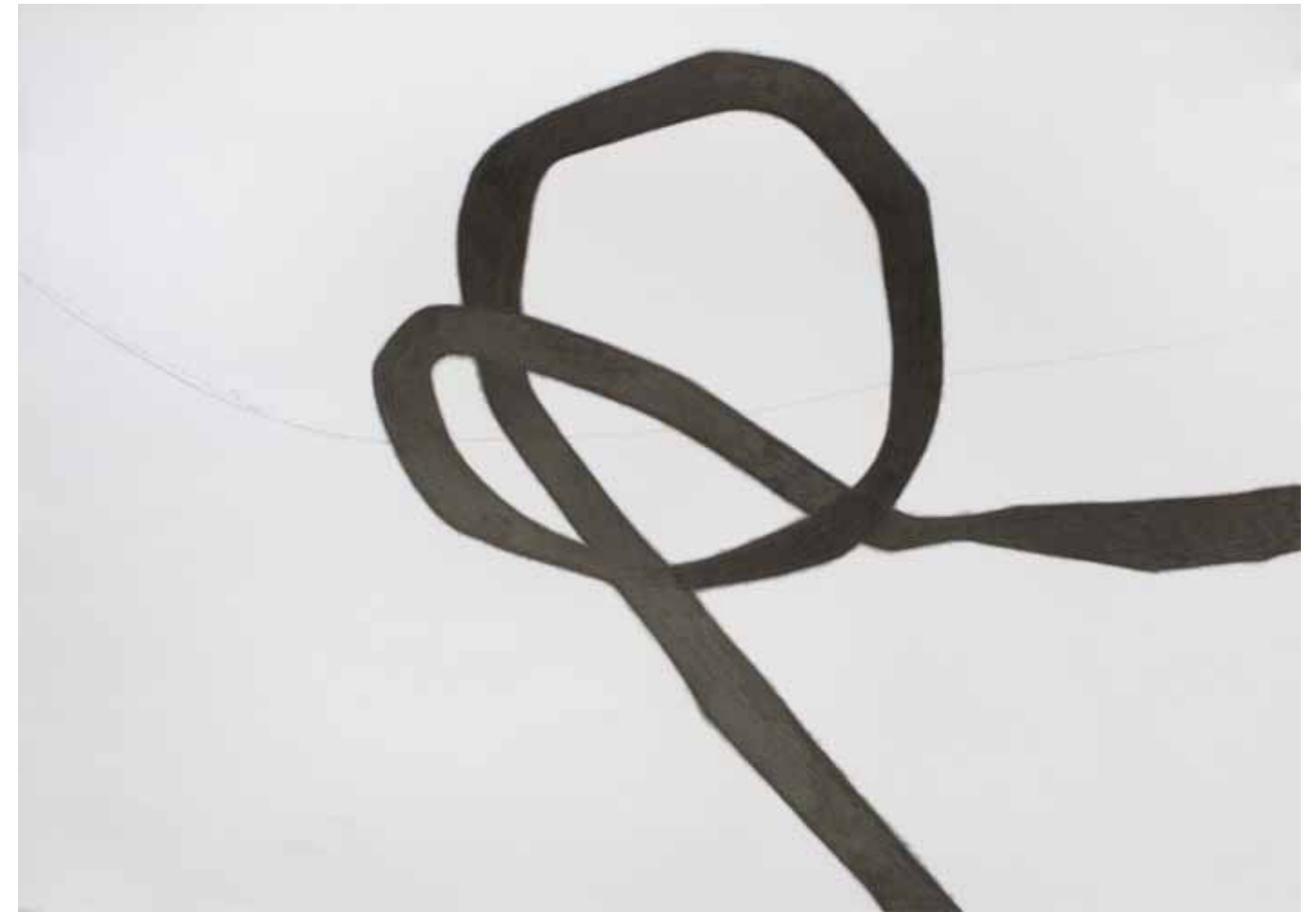
Serie Lineas - 011 grafito y líneas de papel 0,50x0,70 mt. 2012