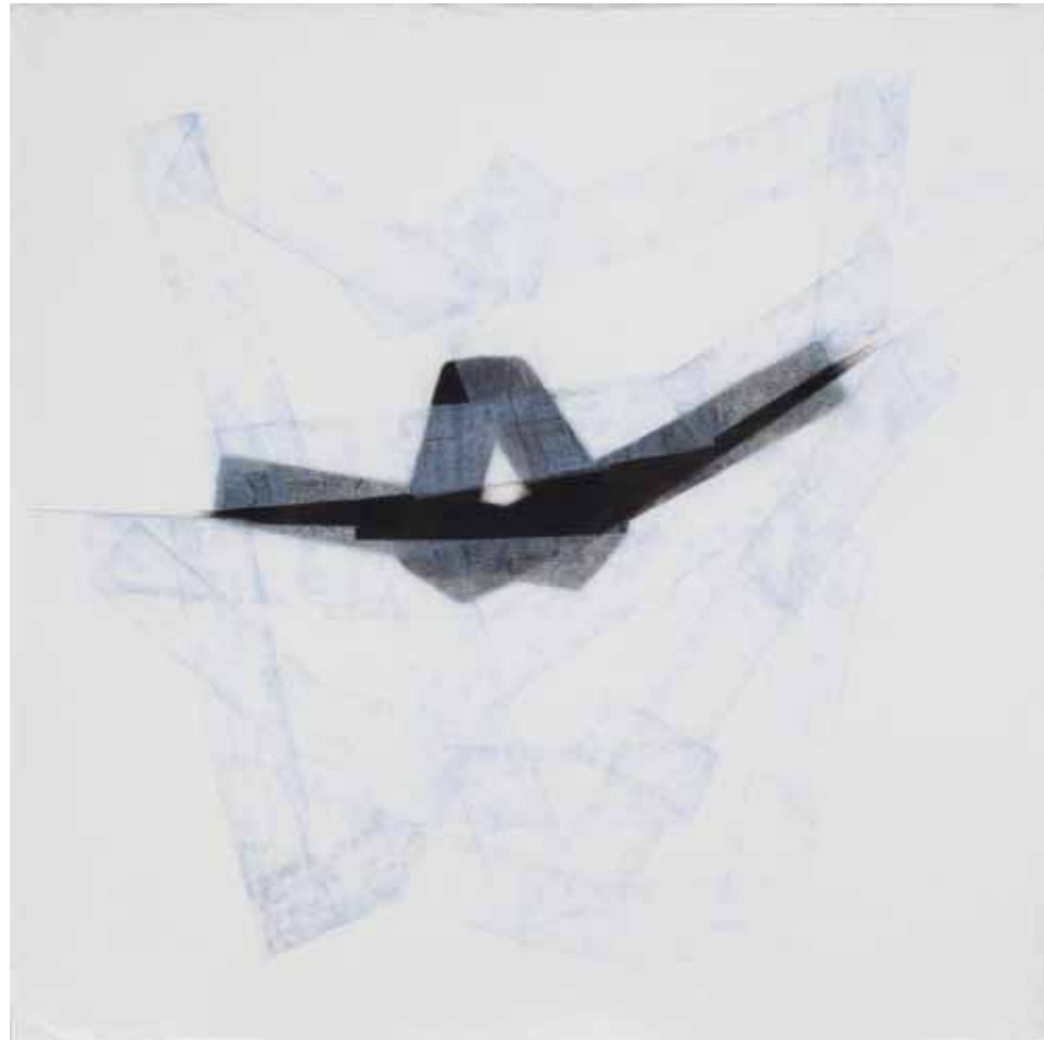
Juego de Papel - T mixta y papel sobre tela 1,50x2.50 mt. 2012