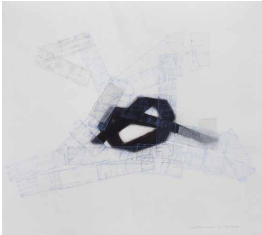
Sostenido - 6 carbonilla, lápiz y papel 0,50x0,56 mt. 2012