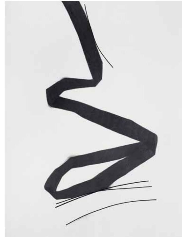
Serie Lineas - 012 grafito y lineas de papel 0,50x0,65 mt. 2012